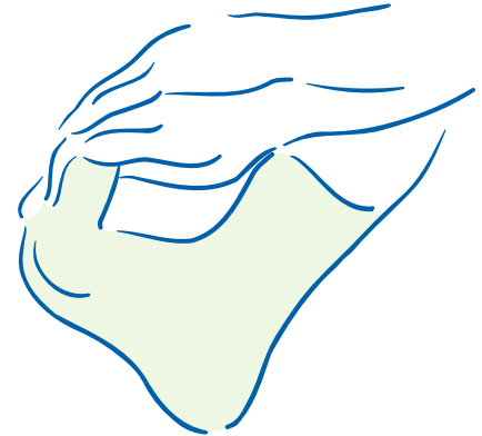
figuur 3. Verder rekken van de voetspieren