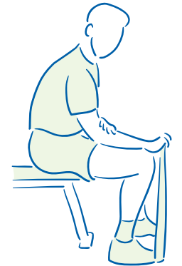
figuur 3. Polsstrekkers