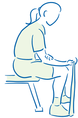
figuur 2. Polsbuigers